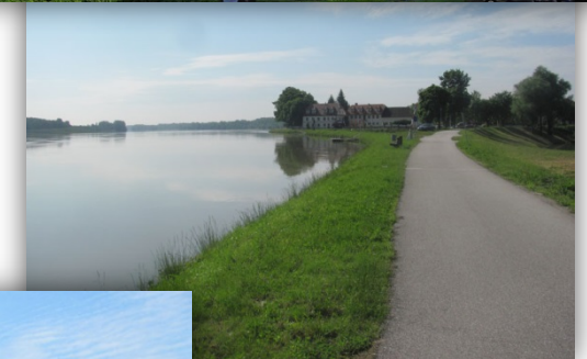
Brandstatt (Blick zur Donau)